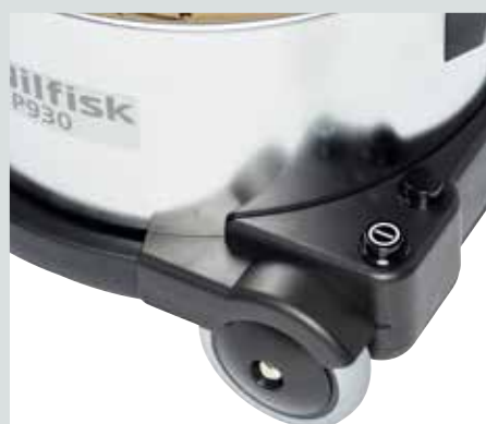
Некоторые модели имеют два режима скорости