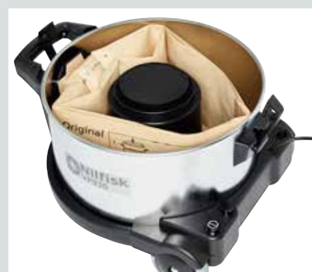
Прочный стальной корпус и 15-литровый пылесборник