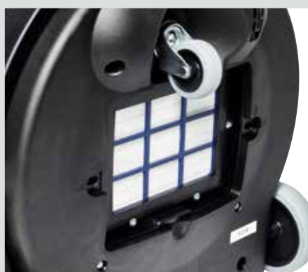
Высокоэффективный выпускной фильтр HEPA H13 гарантирует отличную фильтрацию выходящего воздуха